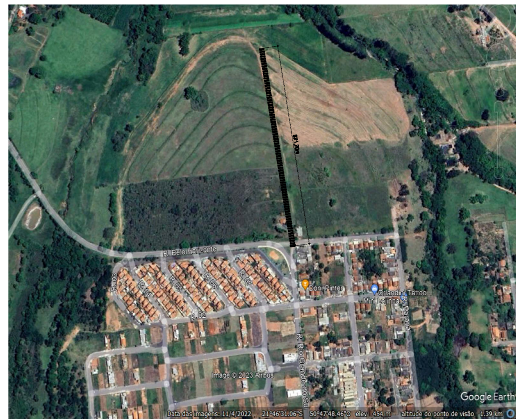
IMAGEM - LOCALIZAÇÃO S/ ESCALA