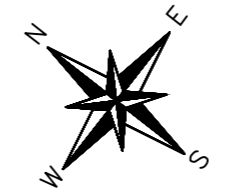
Mapa da Cidade de Parapuã Comarca de Osvaldo Cruz—S.P..